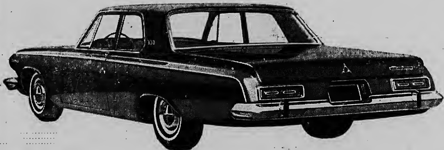
1963 DODGE 330